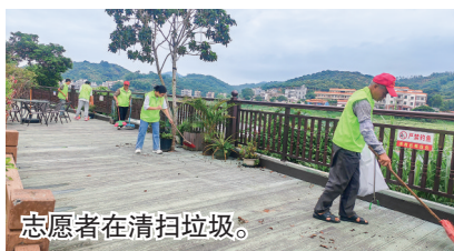
志愿者在清扫垃圾。

茂名晚报讯 记者陈琴 通讯员洗燕玲 洗荣凤 连日高温与雨水交织,积水渐增,易导致蚊虫滋生。为切实守护群众生命健康,严防“基孔肯雅热”疫情,8月4日,高州市巾帼志愿队平山镇巾帼志愿队主动作为,在平山镇仁耀村开展以“消积水、除杂草、扫垃圾、防叮咬”为主题的志愿活动,以实际行动筑牢健康防线。