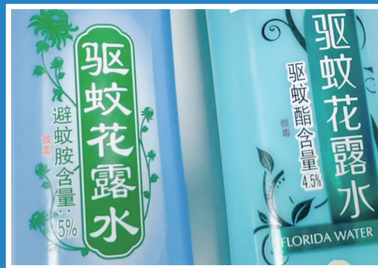
选购驱蚊液看是否含避蚊胺或驱蚊酯。