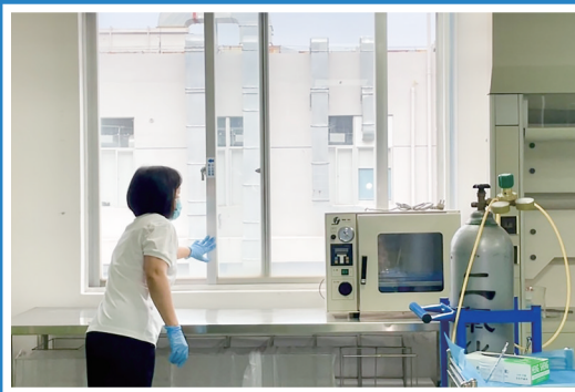
使用杀虫气雾剂静置20分钟后,开窗通风。