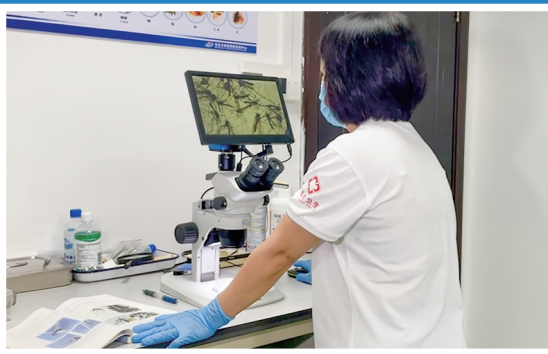
茂名疾控工作人员观察蚊子。