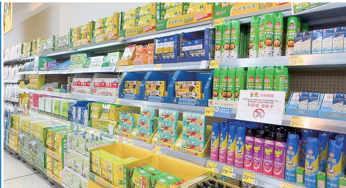
超市驱蚊灭蚊产品。