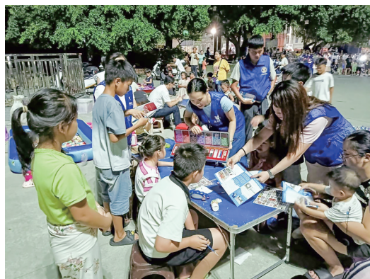
活动吸引许多孩子参加。

茂名晚报讯 记者陈琴 通讯员杨进福 陈玉珍 8月18日晚,电白区马踏人民公园内人群熙攘,一场以“暑期禁毒不打烊 乐享无毒好假期”为主题的禁毒宣传活动在此拉开帷幕。面对暑假青少年社会活动显著增多的关键节点,马踏镇禁毒办联合马踏社区及马踏村,组织禁毒社工与志愿者,共同构筑抵御毒品侵袭的坚实防线,着力提升青少年