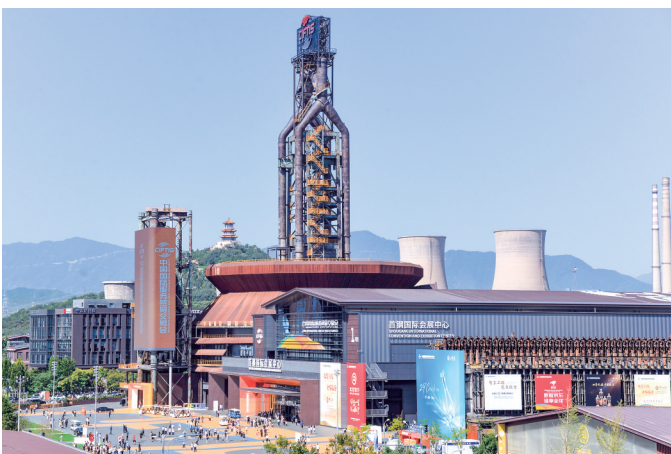
9月14日拍摄的北京首钢园2025年服贸会展馆外景。

走进展区,多款新潮文创让人爱不释手;戴上设备,苏轼笔下的诗词世界任人遨游;指尖轻点,三千年前的青铜器“触手可及”……一系列新产品、新服务、新场景在2025年中国国际服务贸易交易会文旅服务专题亮相,漫步其中,处处感受到科技与创意奔涌、文化和旅游融合的无限活力。