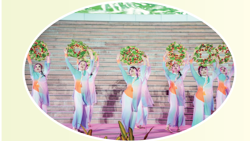
茂名日报社全媒体记者 李陶然 摄