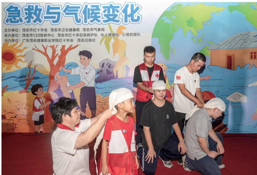
主办单位: 茂名市红十字会 茂名市卫生健康局 茂名市气象局 承办单位: 茂名市120急救中心 茂名市红十字会急救队 水上救援队 心理救援队 协办单位: 广东茂名健康职业学院红十字会 茂名日报社