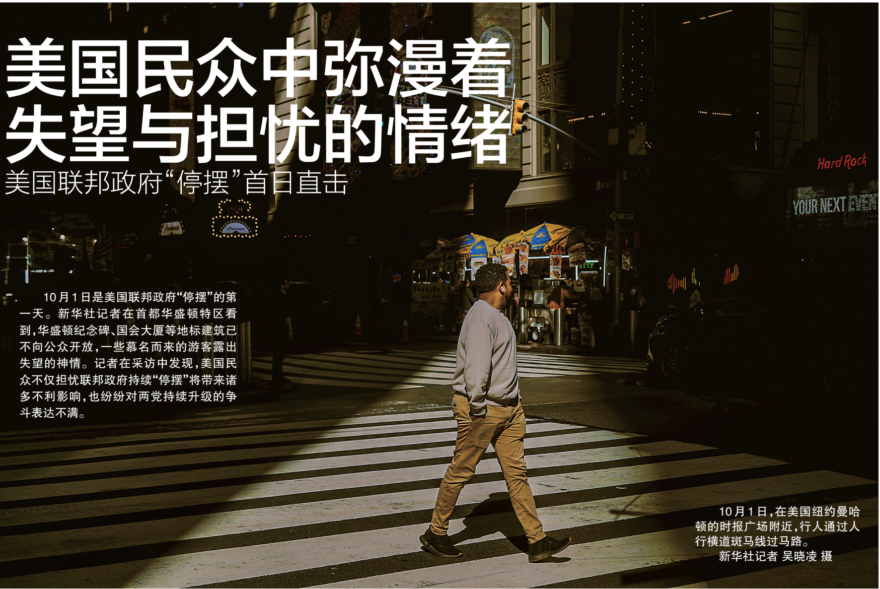
10月1日,在美国纽约曼哈顿的时报广场附近,行人通过人行横道斑马线过马路。

10月1日是美国联邦政府“停摆”的第一天。新华社记者在美国首都华盛顿特区看到,华盛顿纪念碑、国会大厦等地标建筑已不向公众开放,一些慕名而来的游客露出失望的神情。记者在采访中发现,美国民众不仅担忧联邦政府持续“停摆”将带来诸多不利影响,也纷纷对两党持续升级的争斗表达不满。