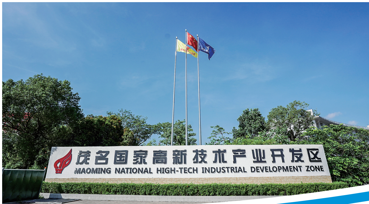
国家级高新技术产业开发区彰显蓬勃发展态势。

走进茂名高新区，一座座现代化炼化装置在阳光下舒展，一根根输送管线延伸交织；20.81平方公里内，中德大道、莱茵大道、工业大道、高新大道等主干道纵横交错，勾勒出园区发展的骨架脉络，已投产的企业生产有序，在建的项目现场机声隆隆，这个位于茂名“两轴一两个圈层”城市布局中组团、连续多年入选中国化工园区30强的国家级高新技术产业开发区内，处处涌动着创新发展的热潮。 今年以来，高新区牢牢锚定“高”与“新”，以回归主业、主抓经济的使命担当谱写发展新篇。