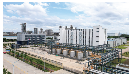
清研新材料研发基地。

产业基金方面，广东省粤东西北产业转移基金茂名市子基金20亿元；佛茂产业协作引导基金10亿元。