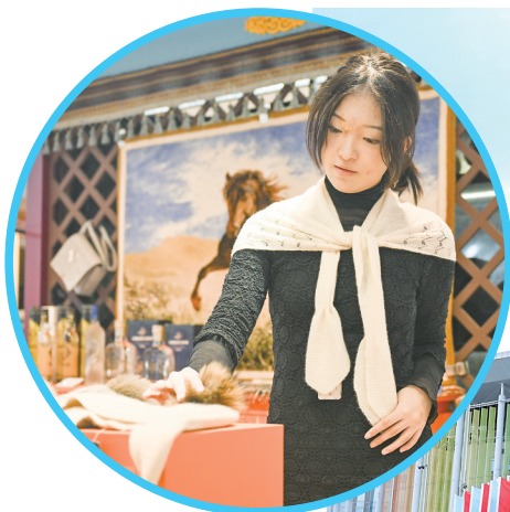
▲11月1日,市民在位于上海市南京东路的“进博集市城市会客厅”挑选商品。

“在中国,人们越来越愿意参与那些能够带来身心平衡与活力的健身、运动或社交活动。”面对中国市场