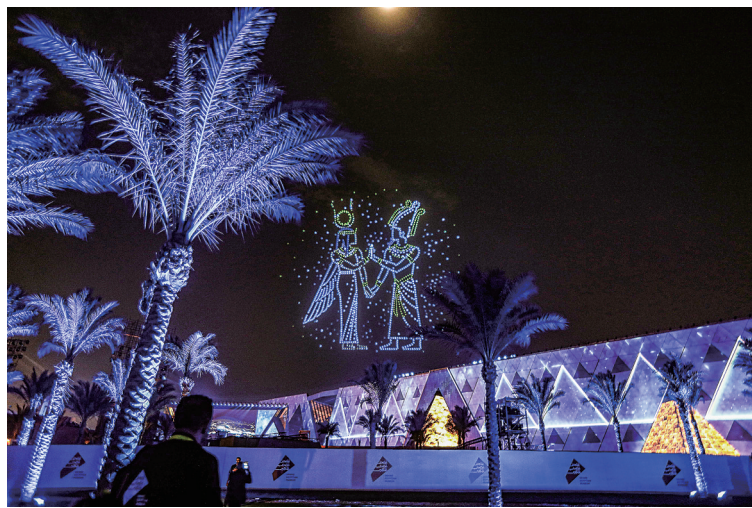
这是11月1日在埃及吉萨拍摄的开馆仪式上的无人机表演和灯光秀。

由于1902年在开罗市中心建成的埃及博物馆在空间和功能上不能满足展览需求,埃及政府于本世纪初在开罗西南约5公里处的吉萨金字塔景区附近兴建大埃及博物馆,后因资金、政治、疫情等挑战,历时20多年才建成开馆。大埃及博物馆占地约50万平方米,馆藏文物超过10万件,首次完整集中展示古埃及法老图坦卡蒙的5992件随葬品,此外还展出修复后的胡夫太阳船、古埃及法老拉美西斯二世巨像等文物。大埃及博物馆将于11月4日正式向公众开放。