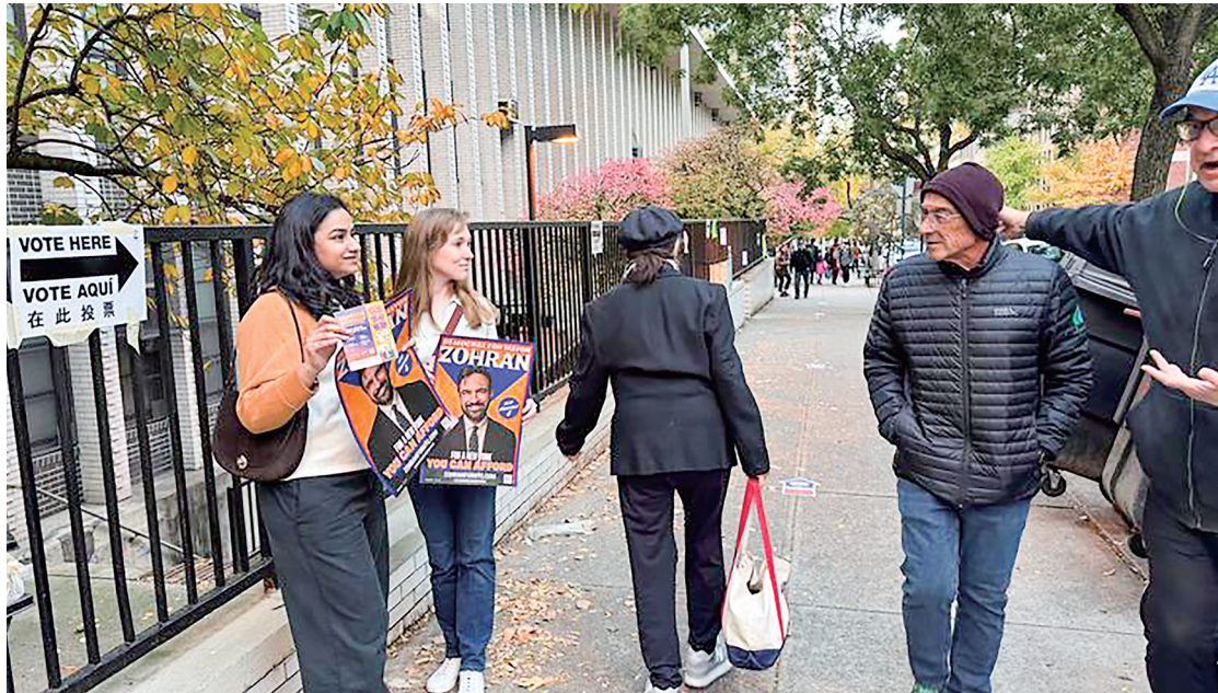
11月4日,支持者在美国纽约一个投票站外手持候选人祖赫兰·马姆达尼的竞选海报(手机拍摄)。

首先,他的主张回应了纽约市民当前最迫切的需求。数据显示,四分之一的纽约人无法负担住房、食品等基本生活必需品。美国房地产网站“找房易”数据显示,纽约市房租中位数6月突破4000美元,比去年同期上涨5.3%。马姆达尼在竞选中提出“提高生活可负担性”方案,表示要解决生活成本飙升问题,主张对富人、大企业增税,提出免费托育、免费公交、冻结房租、新建经济适用房、开设公