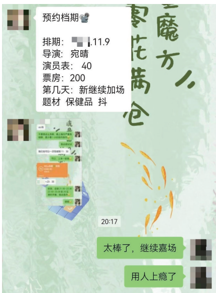
图为某博主发布的直播间“数据‘加热’”服务广告。