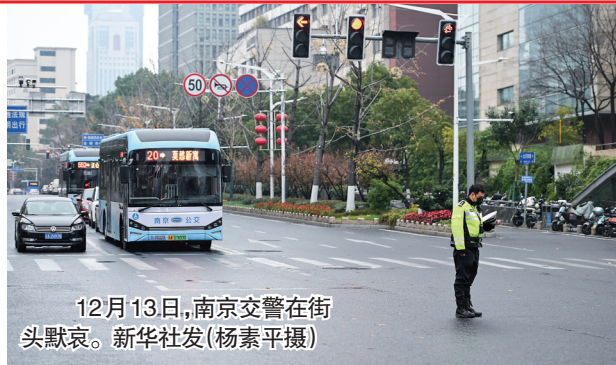
12月13日,南京交警在街头默哀。