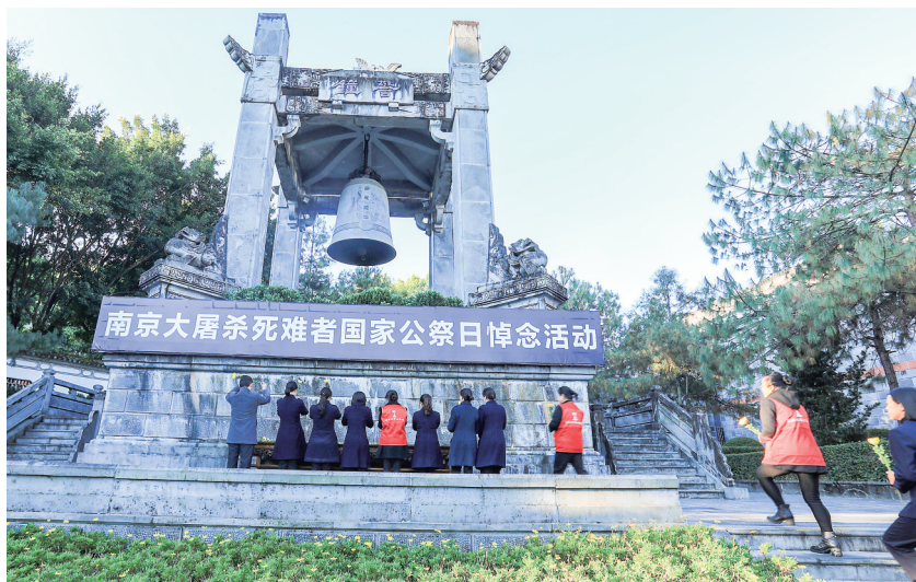
12月13日,在云南腾冲滇西抗战纪念馆警钟广场,工作人员和志愿者列队向抗战英烈敬献鲜花。