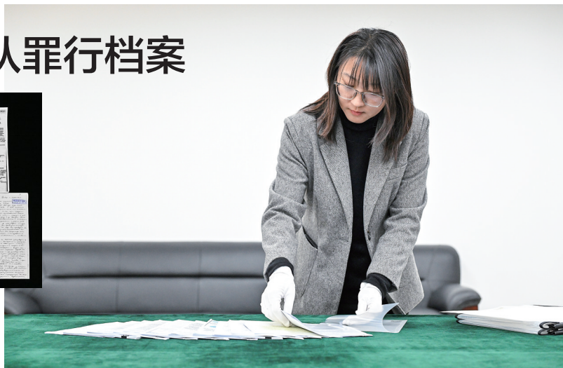
中央档案馆工作人员整理解密档案(资料照片)。

这批档案证据链非常完整,受审罪犯涵盖日军高级、中级、下级军官和人员。档案中,还包含苏联医学、微生物学、寄生虫学等领域的院士专家进行的医学鉴定记录,得出日本人进行细菌研究的目的是利用细菌来大规模毁灭人类的结论,揭露了其