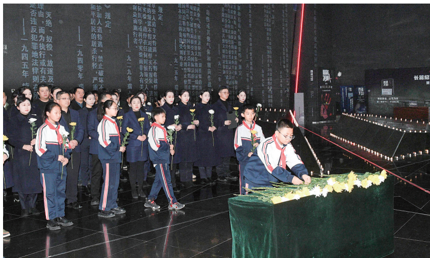
12月13日,人们在黑龙江哈尔滨侵华日军第七三一部队罪证陈列馆参加悼念活动。

12月13日,寒冬凛冽,南京迎来第十二个国家公祭日。上午10时,国家公祭仪式在侵华日军南京大屠杀遇难同胞纪念馆集会广场庄严举行,国旗半垂,哀乐低回。约8000名胸佩白花的各界代表垂首默立,防空警报撕裂长空,将人们的思绪带回88年前的黑暗岁月——30万同胞惨遭杀戮,古都南京满目疮痍。