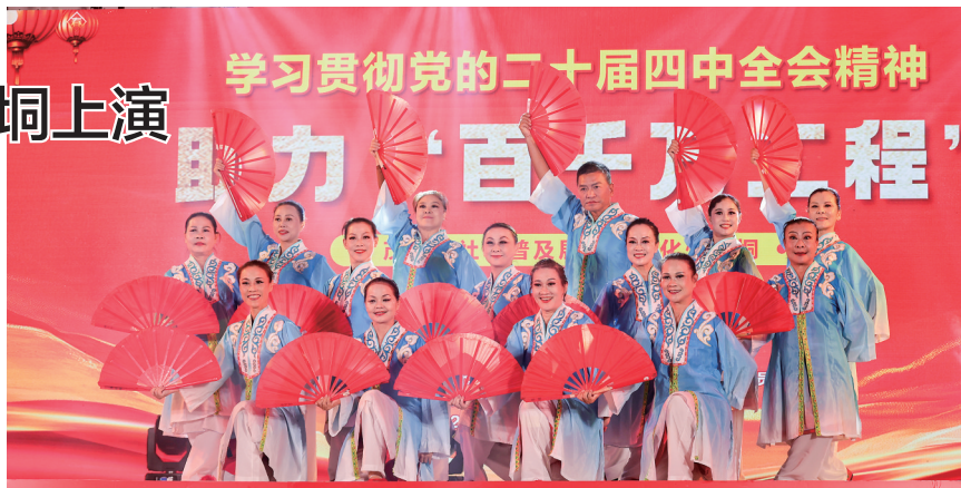
长扇舞《江山》。

此外,《缘是茂名荔枝来》巧妙融合木偶戏、粤剧等元素,讲述“一骑红尘妃子笑”的千年佳话;《禾楼舞》带领观众穿越