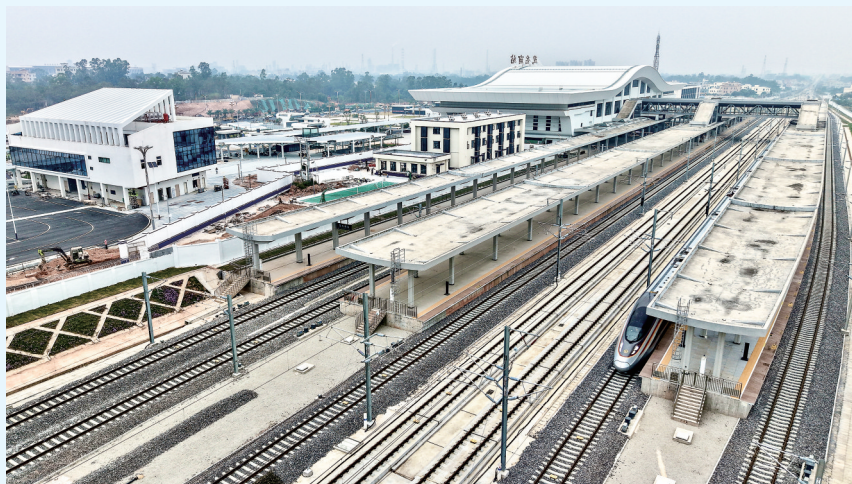
3台5面7线站台。

同属广湛高铁线上的马踏站,位于电白区马踏镇,为既有站房改扩建工程,车场规模2台4线。该站以“仙人飞马,踏印留痕”为设计理念,向前冲出的屋顶结合立面动感的线条,模拟仙马腾飞的气势,建筑整体形象鲜明,体现了交通建筑的时代感与速度感。