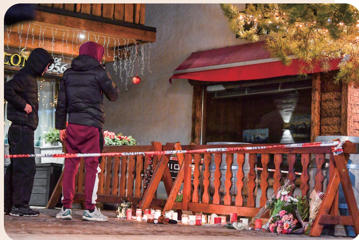
▲2026年1月1日,人们在瑞士克朗-蒙大拿悼念酒吧火灾事件遇难者。