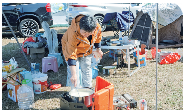
平云山营地一游客在煮粥。