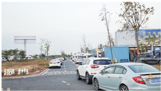
水东湾海洋公园停车场外停放的车辆。