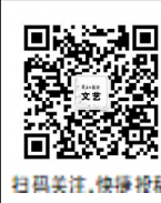
扫码关注，快捷阅读