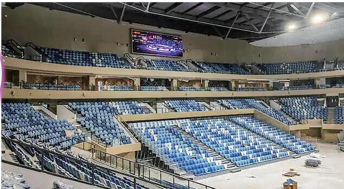
配备全自动活动看台。

据悉,此次省运会期间,体育馆将承担篮球、羽毛球、拳击、体操、跆拳道、网球、摔跤、霹雳舞等多个项目的比赛。目前相关赛事配套设施已安装完成,正进行最后阶段的调试优化。