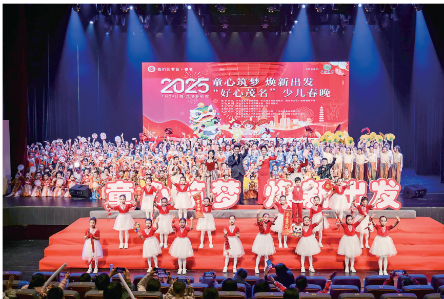
2025年少儿春晚。

本次活动自即日起面向全市开启报名,截止时间为2026年1月25日24:00。报名结束后,将在2026年1月底进入节目编排期,对入选节目进行集中打磨;2