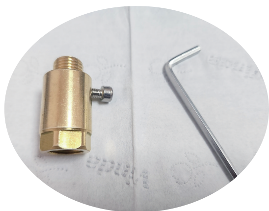
记者在网购买的“尿素调节螺丝”。