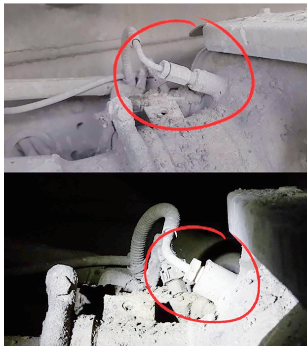
拼版照片:上图为大货车尿素喷射系统的后处理器上被加装螺丝的状态,下图为拆掉螺丝恢复正常的状态。 (2025年9月24日摄)