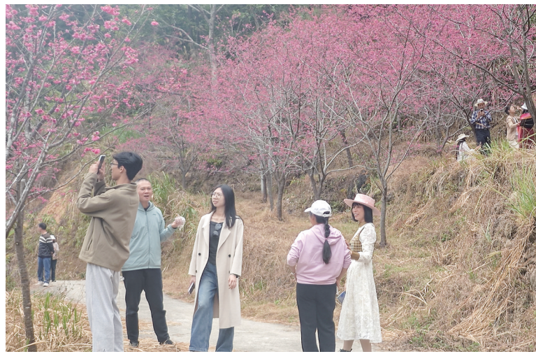
众多游客前来赏花。

茂名晚报讯 记者李光耀 2月6日,茂名晚报记者来到高州市马贵镇甘涌下水尾村樱花谷。这里的近200亩紫红樱花如期盛放,漫山遍野如霞似锦,虽不是周末,仍吸引了众多游客前来踏春赏花、拍照打卡,现场洋溢着喜庆欢乐的新春气息。