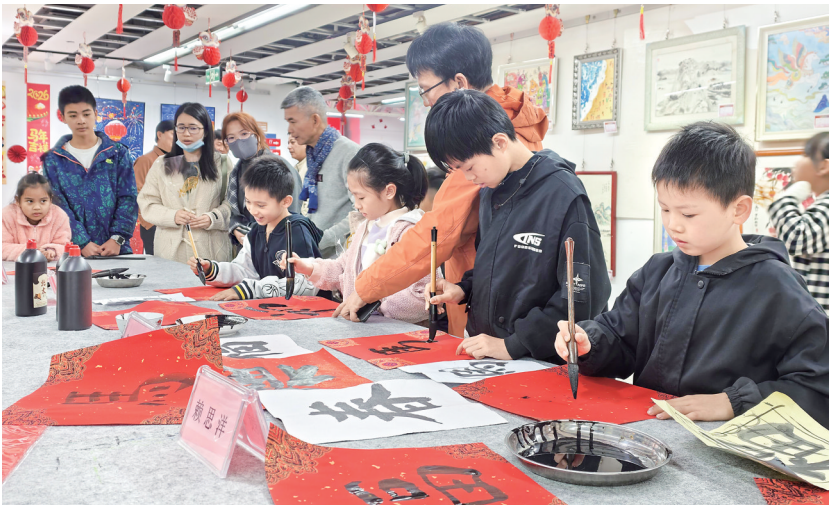
展览现场,孩子们积极参与趣味体验活动。

茂名晚报讯 记者冯小飞 9日上午,第12届“好心茂名”2026年茂名市少儿美术迎春展览在茂名市文化馆艺术中心正式启幕。本次展览由茂名市文化馆主办,茂名市美协少儿美术艺委会协办,集中展出200件优秀少儿美术作品。创作者们以童真画笔描绘家乡风貌,用艺术创意传承“好心精神”,为马年新春营造了浓厚的文化氛围。