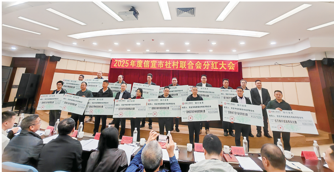
村集体代表接过分红支票。

茂名晚报讯 记者李光耀 通讯员高干 莫慧欣 近日,信宜市2025年度“社村”合作分红大会现场喜气洋洋,65个村集体代表接过沉甸甸的分红支票,总额达386.56万元。钱排镇钱排村因贡献突出,独享18.7万元最高分红。这场分红大会,不仅是真金白银的丰收,更标志着以“供销社+村集体+农户”为核心的乡村振兴“信宜模式”结出扎实成果。