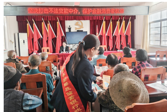
工作人员为群众普及金融服务知识。

茂名晚报讯 记者和沛蓉 通讯员吴德忠 林戈 刘艳萍 何彩霞 春节前夕,中国邮政储蓄银行信宜市支行深入金垌镇高车村、光荣村,走访慰问困难群众和特殊群体,送上大米、花生油、面条等生活物资,并开展金融知识宣传服务,以实际行动传递温暖与关怀。据悉,这是该行连续第六年到金垌镇帮扶村开展新春慰问走访活动。