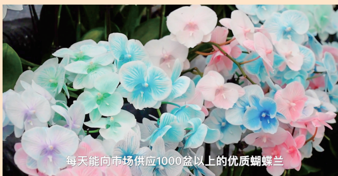
每天能向市场供应1000盆以上的优质蝴蝶兰

春节期间,河南多地花卉市场热闹非凡,各色年宵花竞相绽放,迎来销售热潮。市民走进花卉市集,挑选心仪花卉,在花香中感受年味,“美丽经济”释放消费新活力。