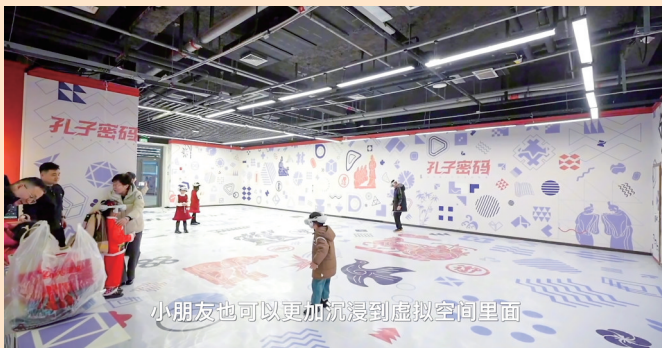
小朋友也可以更加沉浸到虚拟空间里面

当博物馆遇上中国年,会碰撞出什么样的火花?位于山东曲阜的孔子博物馆这次可是放大招了!六大展览齐上线,从《孔府过大年文物展》里的年俗老物件,到用VR穿越古今的“孔子密码”体验,再到讲述黄河文明的奇妙展陈……文物不再“高冷”,反而变得可亲、可感、可互动。