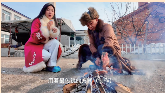
用着最传统的方式(制作)