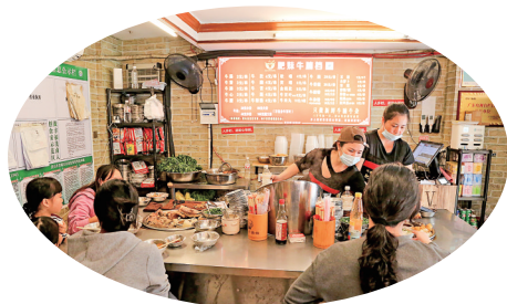
市民在牛杂店大快朵颐。

从文艺潮流的荔红啡巷走出,循着香气继续前进。第二站,记者来到文光二街牛杂特色街。这里的年味是沸腾的、滚烫的,一口牛杂下肚,便是刻在茂名人心底的家乡味。街上沿途设置的多个牛杂街主题打卡点,又为市民游客在品尝牛杂之余,增添了几分节日乐趣。据了解,这些牛杂街主题打卡点由当地街道办设置,助力牛杂街发展。