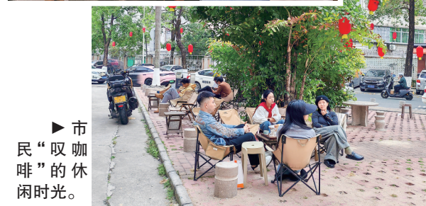
▶市民“叹咖啡”的休闲时光。