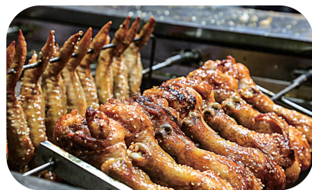
▲美味诱人的烧烤鸡翅。