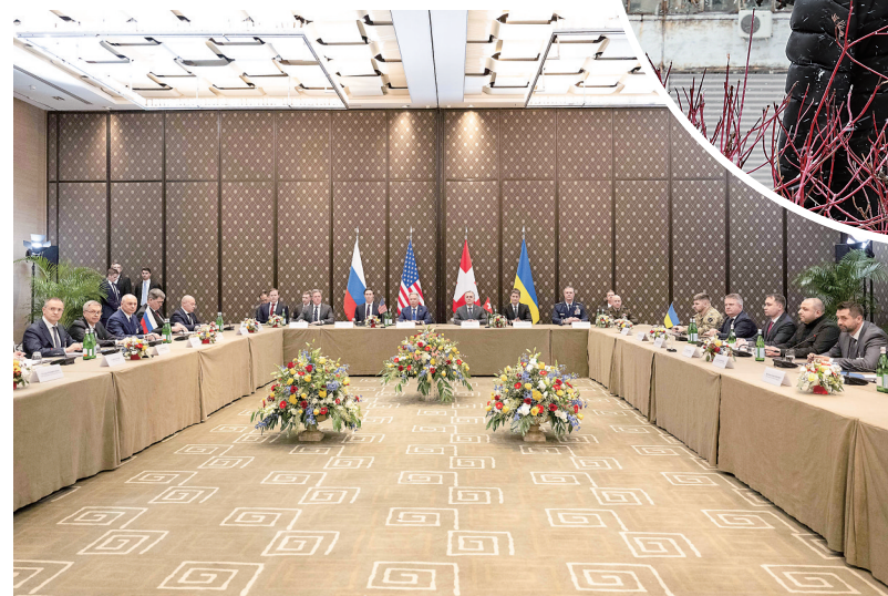
◀这是2026年2月17日在瑞士日内瓦拍摄的俄美乌三方谈判现场。