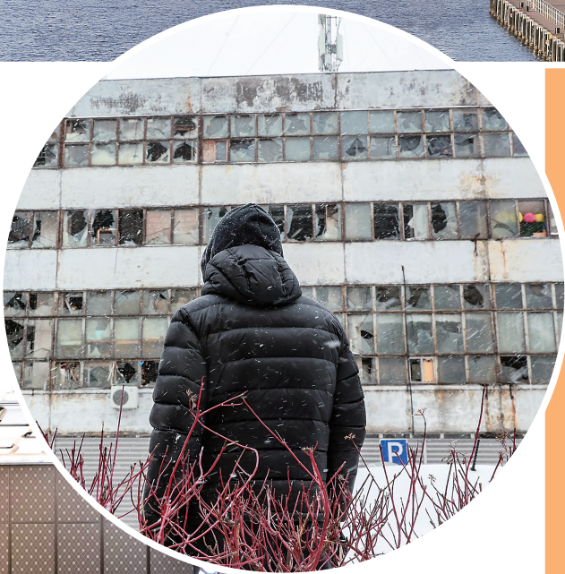
▶2026年1月9日,一男子在乌克兰首都基辅市第聂伯区查看空袭中受损的建筑。