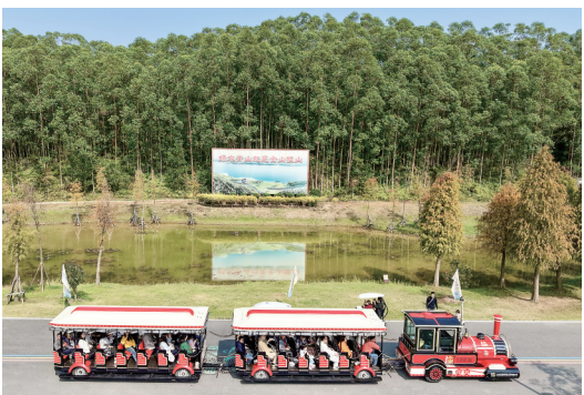
游客搭乘小火车游览露天矿生态公园。