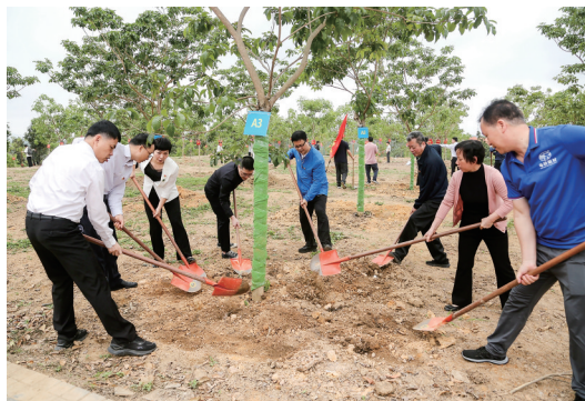
“绿美茂名·好心林”公益植树为茂名增添一片新绿。

文/茂名日报社全媒体记者 李君平