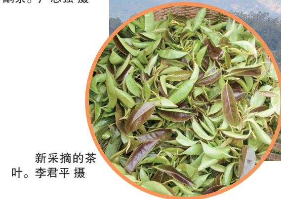
新采摘的茶 叶。

茂名晚报讯 记者李君平 茶以春为贵，春因茶而忙。春分时节，信宜大雾岭的茶园逐渐热闹，全面开采。每天清晨，茶农便背着竹篓上山采茶，忙碌的身影与青翠茶垄构成了一幅生机盎然的春日画卷。近年来，在信宜市和大成镇两级党委、政府带领下，该镇上湾村依托大雾岭得天独厚的生态优势，坚持以茶兴村、以茶富民，依托“公司+基地+农户”模式，把小茶叶做成大产业，把绿水青山变成金山银山，真正实现生态美、产业兴、百姓富。