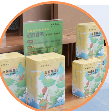
大雾腾云高黄 酃茶。