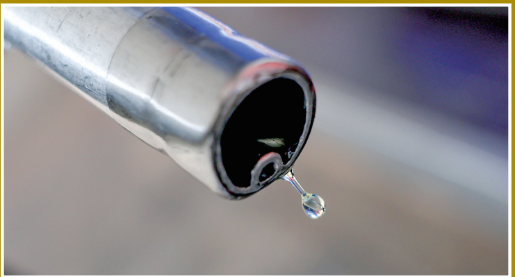
3月26日,在英国伦敦一处加油站,汽油从油枪口滴落。受美国和以色列与伊朗军事冲突影响,英国加油站燃油价格持续走高。