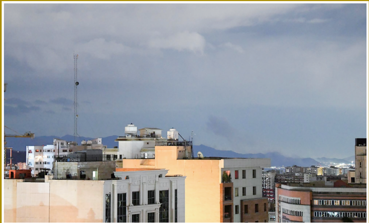
这是3月28日拍摄的德黑兰市区。