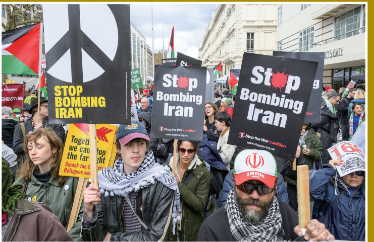
3月28日,人们在英国伦敦参加集会,抗议美国和以色列对伊朗发动军事打击。