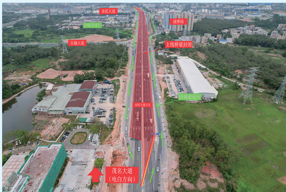
市民大道立交临时封闭疏导方案。

项目相关负责人表示,此次桥梁荷载试验是保障工程质量和通行安全的必要举措,因施工封闭给周边单位、居民及过往群众带来的不便,敬请广大市民给予理解、支持与配合。相关单位将科学组织、规范施工,力争高效完成试验工作,尽快恢复桥梁正常通行,为市民出行提供更安全、便捷的交通保障。