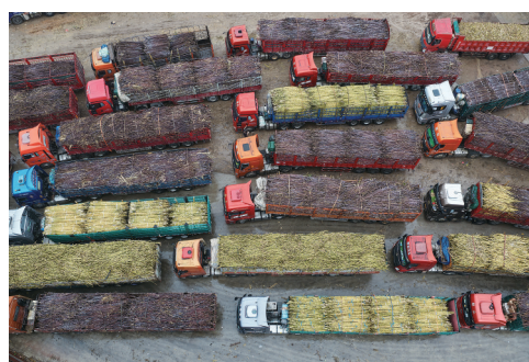
井然有序的货车队伍。

在采访中,看到的是司机们热情打招呼的笑脸,是三百辆货车长龙里的秩序与包容,是一个企业“不计成本”的善意与担当。蔗农的燃眉之急得以解决,异乡司机“认识了温暖的化州”。这就是一座好心之城的温度。甘蔗的甜,甜在嘴里;人心的甜,甜在彼此守望里。