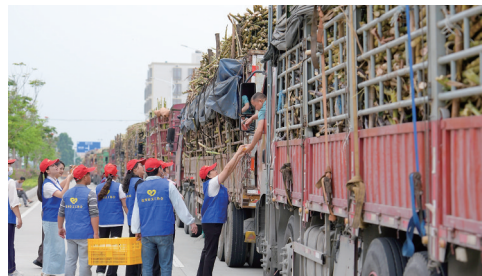
志愿者抬着整筐化州糖水逐个派送给司机。