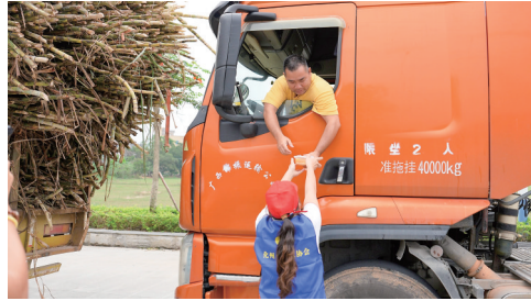
化州糖水店为司机送上化州糖水。