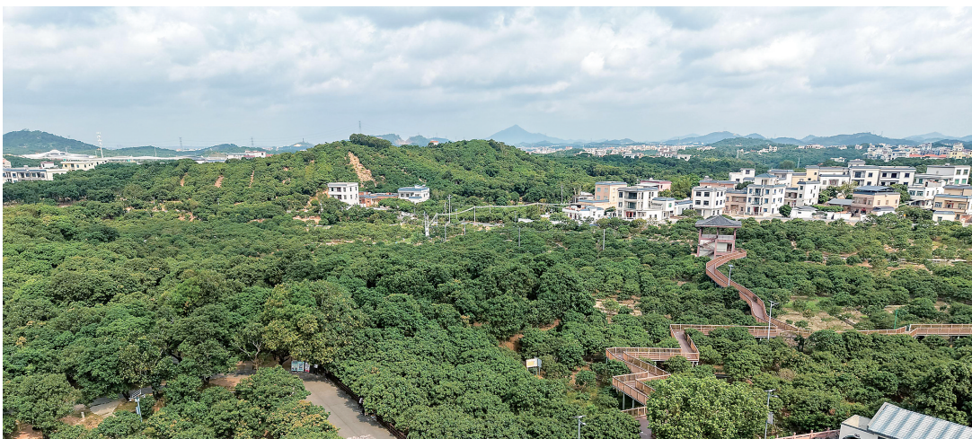
俯瞰高州市根子镇柏桥古荔园。

茂名古荔园中不仅保存了大量古荔枝树，而且随之留存下了中国最古老的荔枝品种。在茂南羊角禄段古荔园保留了黑叶、白蜡等品种，高州泗水滩底古荔园保留了进奉、妃子笑、白蜡等品种，高州根子镇柏桥古荔园保留了黑叶、白糖罂等品种，电白霞洞古荔园则保留了黑叶、砸死狗、进奉等品种。经权威部门测定，这些古树大多有一千多年历史。