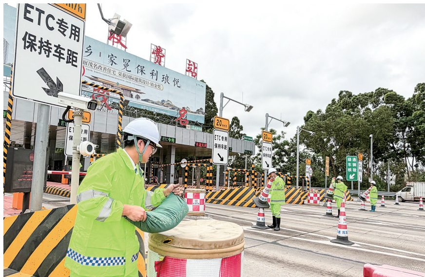
茂湛、包茂高速一线工作者严阵以待,全力加强站场通行及汛期安全防护应急演练。

与此同时,茂湛、包茂高速广大工作者全天候坚守在岗,竭诚为公众提供周边文旅推介、路线指引、ETC安装咨询、免费茶饮和暖心“义修”等便民服务,让