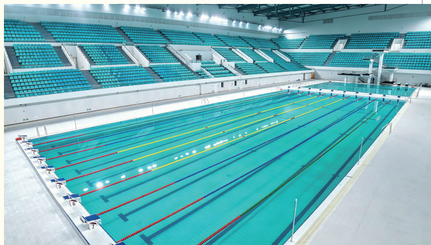
茂名奥体中心游泳跳水馆。