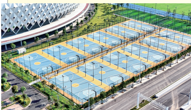
茂名奥体中心户外全民健身中心篮球场。