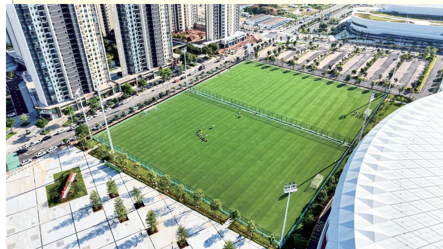
茂名奥体中心户外全民健身中心天然草皮标准足球场。

办好体育盛会,最终落脚于民生福祉。如今,茂名奥体中心已然整装就绪,不仅将以一流场地、一流服务保障省级体育盛会圆满举办,更将以开放共享的姿态服务市民生活。随着场馆后续全面开放,这座崭新的体育地标将持续释放民生红利,丰富市民健身休闲场景,完善城市公共体育服务体系,切实提升群众的获得感与幸福感。