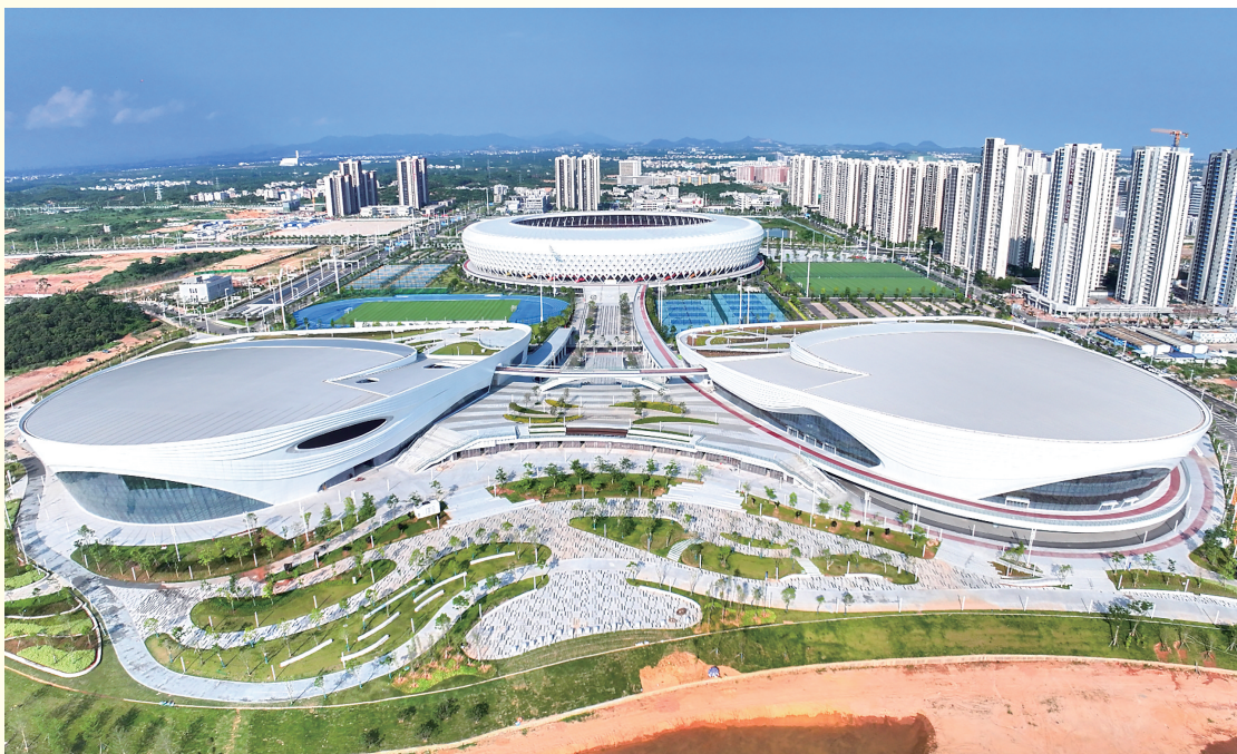
俯瞰茂名奥体中心。

户外全民健身中心依托体育场连片规划、统筹建设,配有2片天然草皮标准足球场、12片篮球场、10片网球场与2片人造草五人制足球场,全面兼顾专业赛事举办与群众日常健身需求,将承担足球、网球、特奥足球等赛事承办工作。