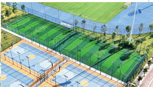
茂名奥体中心户外全民健身中心人造草五人制足球场。