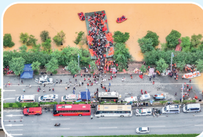
▲7月9日,在广西贵港市西江教育园区,被困学生有序上岸(无人机照片)。