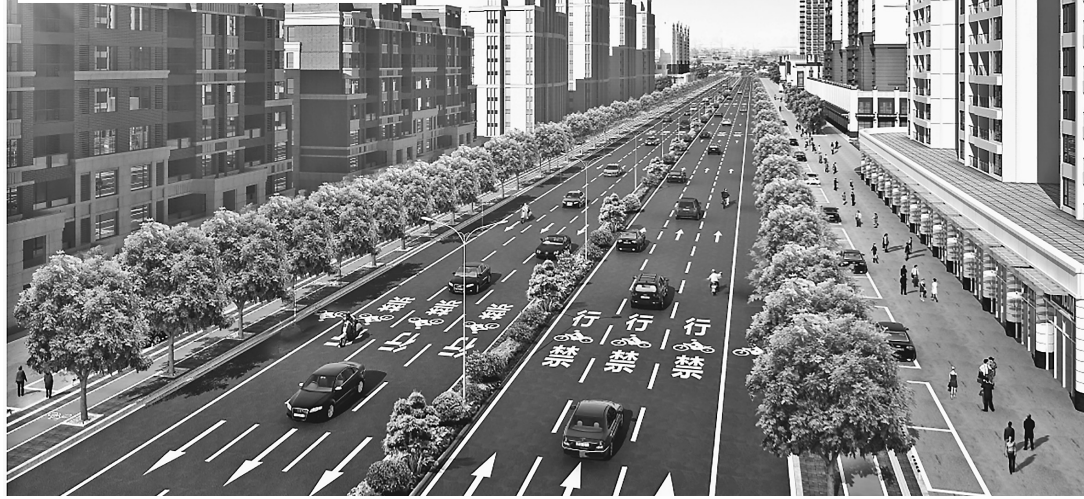
大图是高凉南路(新福路至站北路段)设计效果图,左上小图为建设施工现场。