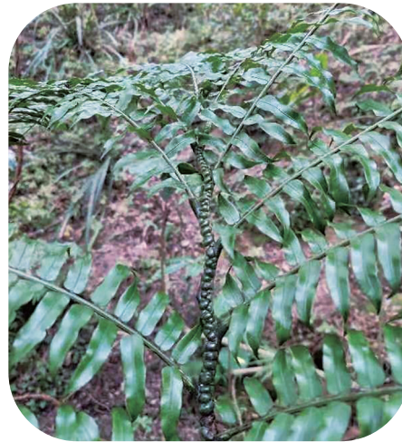
观音莲座蕨。