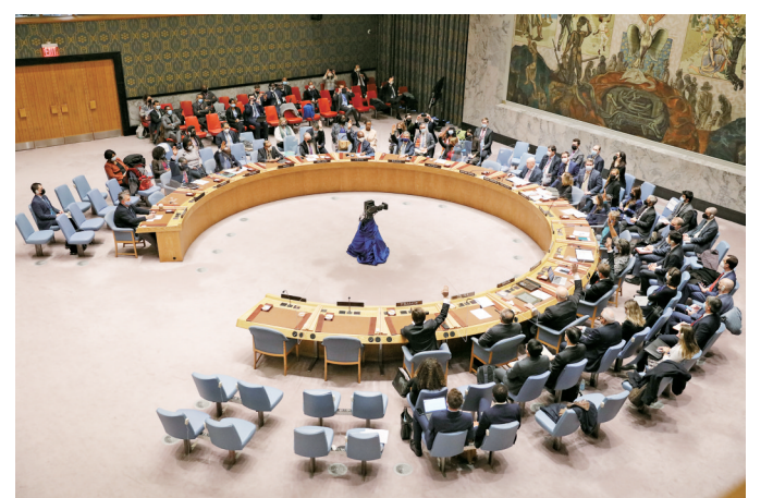
2月25日，在位于纽约的联合国总部，联合国安理会就决议草案进行表决。

联合国秘书长古特雷斯在会议结束后对记者表示，联合国不会放弃寻找解决乌克兰危机的办法，同时呼吁冲突各方更好地保护平民。他说：“我们必须再给和谈一次机会。士兵们必须回到军营。领导人需要转向对话与和平的道路。”古特雷斯还宣布任命来自苏丹的阿明·阿瓦德为助理秘书长，担任联合国乌克兰危机协调员。