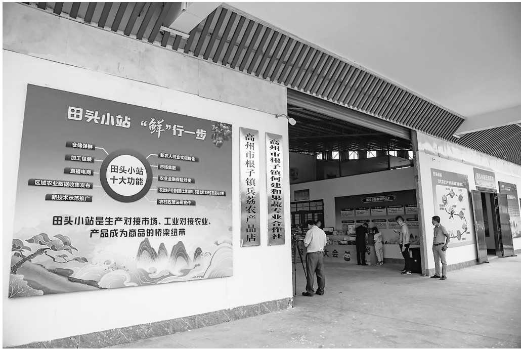
高州根子镇农产品仓储保鲜冷链物流田头小站。

我市行业监管力量;深入推进快递市场诚信体系建设,建立违法失信企业“黑名单”和违规寄递处罚警示制度。另一方面,深化部门联动机制,继续发挥寄递渠道安全管理领导小组协作联动机制,充分应用联席会议、联合督导、联合执法、案件移送、信息通报等联动工作机制,联合相关部门共同做好寄递渠道禁毒、打击侵权假冒、危险化学品整治等专项工作。同时强化主体责任落实,督促寄递企业完善安全管理内控制度,强化企业对其分支