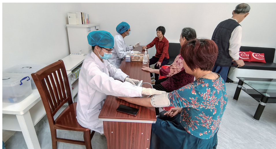
社区人才驿站便民服务平台开展志愿服务活动。图为医疗卫生人才为社区居民测量血压。