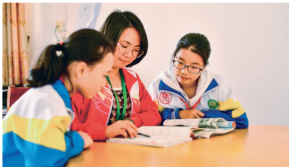
搭建社区人才驿站便民服务平台,开展志愿服务活动。图为教师人才为社区学生开展教育辅导活动。

通过“三凝聚三发挥”的措施,集聚单位、党员、人才的力量,一批民生实事得到落实。图为建成后的金岭小区口袋公园。