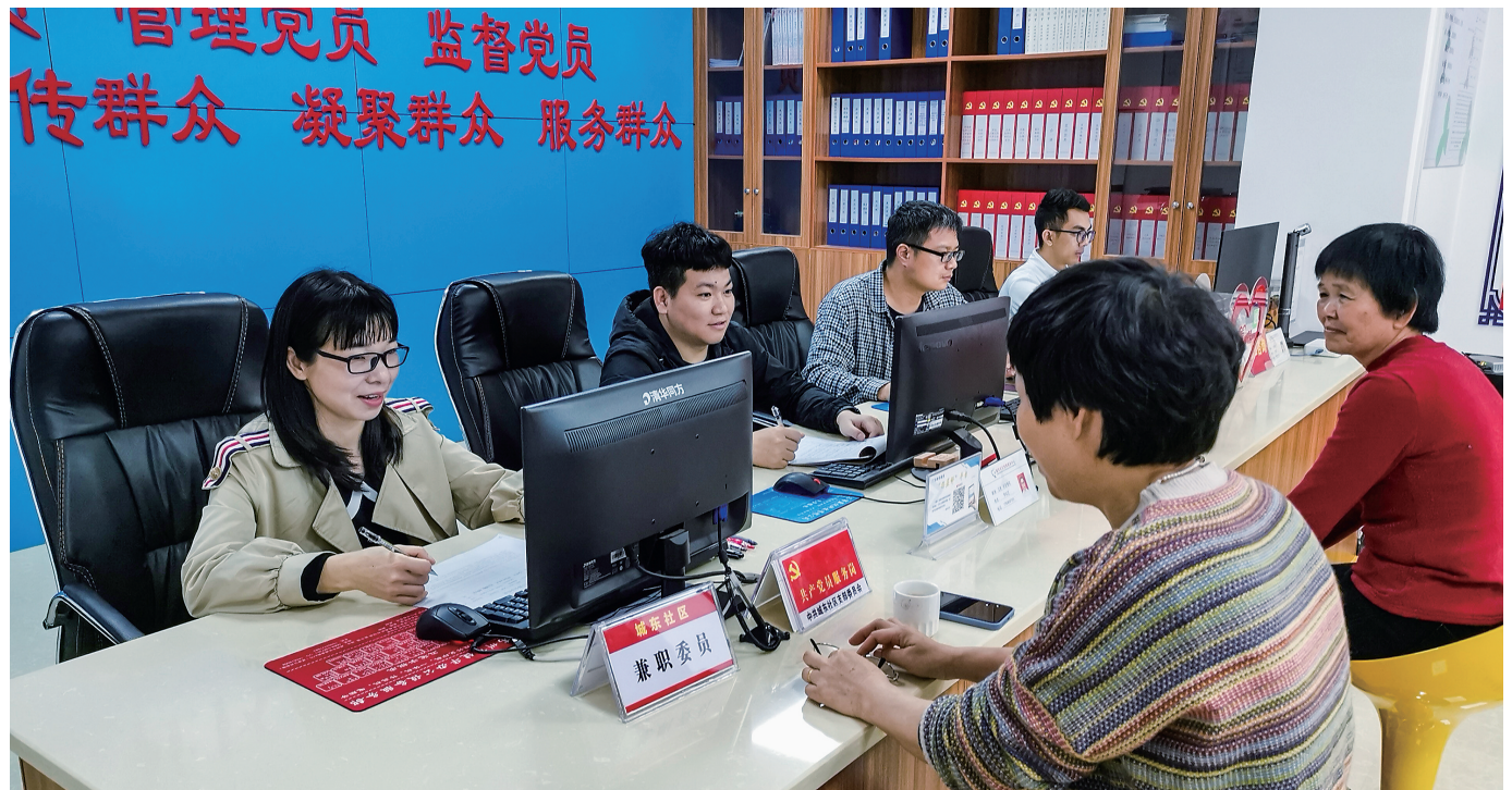
城东社区实施兼职社区委员制度,促进共建单位互联互通,更好落实惠民政策。

“12345”工作体系的推行,是高州市委组织部抓规划指导、山美街道党工委抓统筹协调、城东社区党组织抓组织实施、辖区单位抓协作实施的三级工作机制下的成果,通过凝聚和发挥城东社区辖区内单位、党员、人才的力量,使“12345”工作体系得以自上而下顺利运转,为基层治理工作开启新的模式,全力打造“美好生活社区”样板。