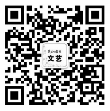
扫码关注 快捷投稿