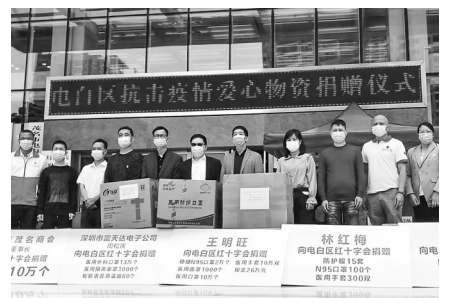
电白区抗击疫情爱心物资捐赠。