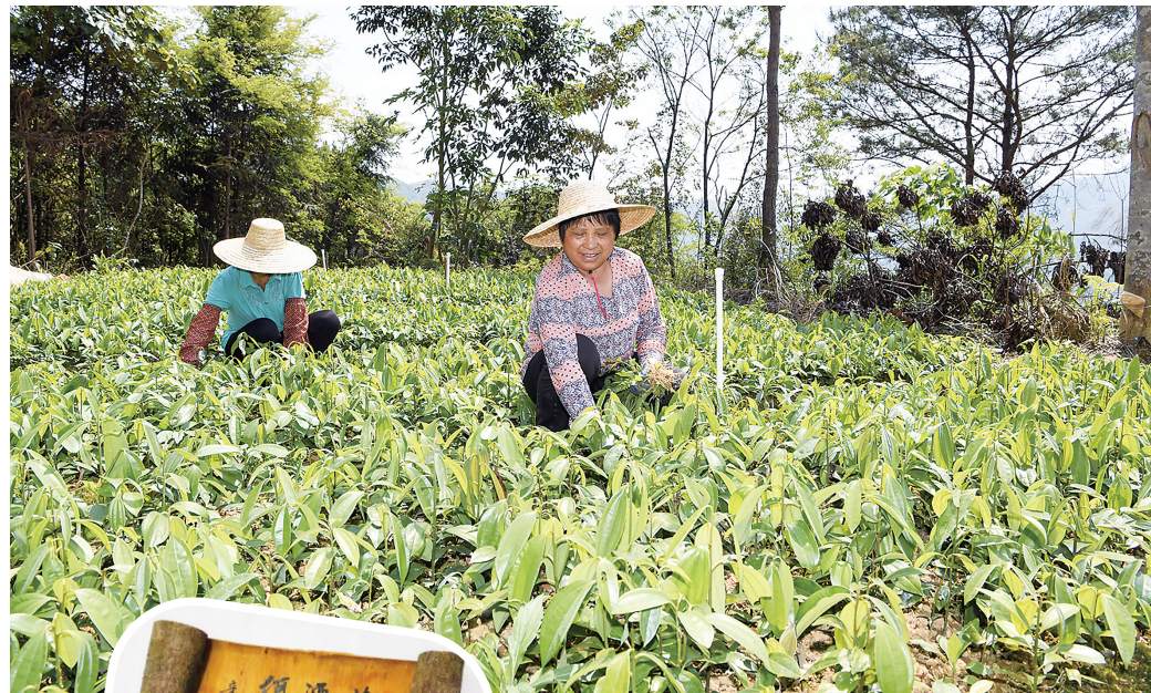
▲村民在培育肉桂苗。

由于近年村民外迁、外出,目前仅35名村民常住村中。结合该村劳动力少、山地多的实际,驻该村的帮扶工作队与村两委认真谋划,发展了苗圃场,培育袋装苗,更进一步方便群众种植肉桂。并积极发动在家群众利用好山地资源,扩大发展肉桂种植。今春扩种后,该村有约60万株肉桂树(含老树)。