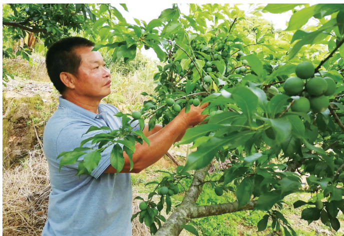
黎某在观察三华李果子生长情况。

该村干部群众自豪地说,当地的藿香、沙姜生产名声在外,现在又可以成功种植三华李,为充分利用土地,振兴乡村经济提供了新思路,绿水青山的大冲村真是大有可为。