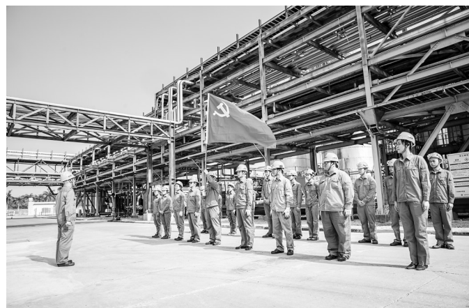
装置检修,党员骨干带头。