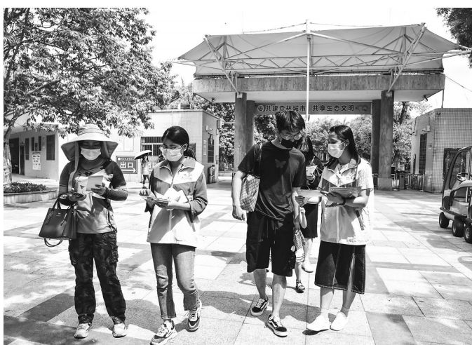
图为市文化广电旅游体育局的文明旅游志愿者在森林公园开展文明旅游宣传活动。

据悉,市委、市政府高度重视动漫剧《好心宝宝之洗夫人》制作,将其列入《洗夫人文化发展纲要》“十一个”工程项目,列入市委年度重点工作项目,今年将完成《好心宝宝之洗夫人》动漫剧第二季26集的制作工作。