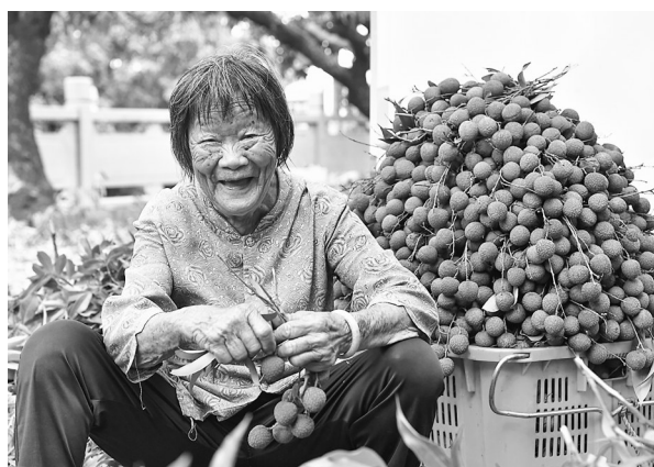
收获季,八旬婆婆笑开颜。