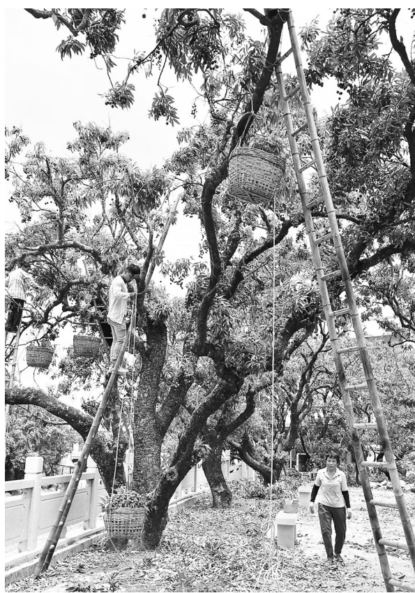
一棵老荔枝树五六个人一起采摘需要两个小时。