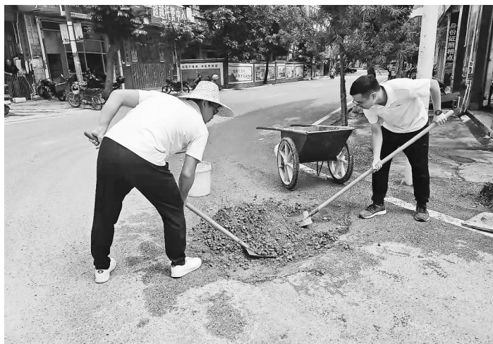
党员志愿者在修路。

阵地”,在密切党群关系上发挥了大作用。下一步,我们将继续坚持党建引领,整合各方资源、凝聚各方力量,进一步完善党员志愿服务驿站的各项便民服务