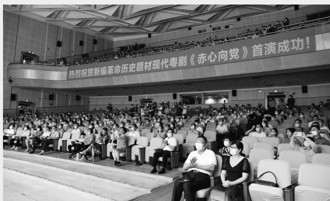
精彩表演获得观众热烈掌声