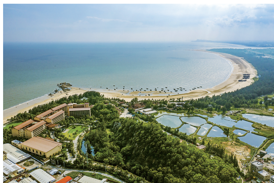
浪漫海岸度假区距离旅游公路仅100米。

8月15日,广东滨海旅游公路茂名先行段正式开通,一线连通博贺湾、龙山湾、水东湾和南海第一滩,实现了茂名滨海旅游景区一线牵。