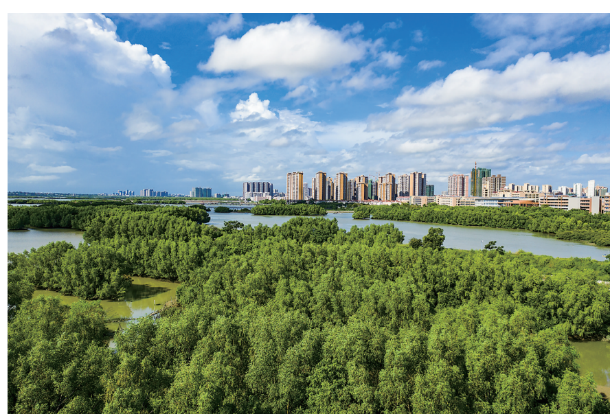
水东湾红树林景色。