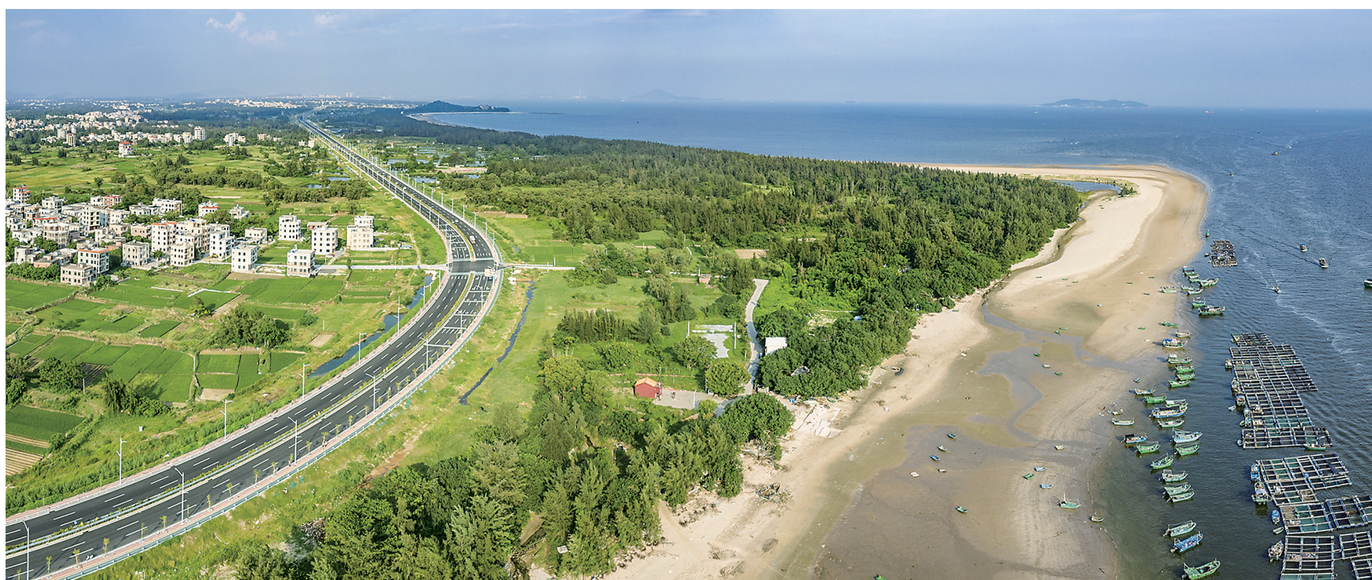
广东滨海旅游公路电白区西葛段。