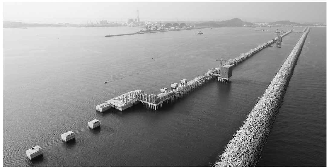
茂名港博贺新港区东区油品码头工程施工现场。

据悉,项目建成后将为茂名港打造海上能源新通道奠定坚实基础,为茂名打造千亿级临港产业集群提供强劲助力。