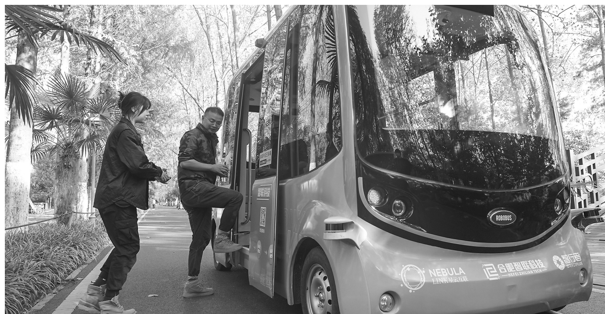
10月11日,在合肥滨湖国家森林公园,游客准备乘坐自动驾驶观光车。近日,安徽合肥滨湖国家森林公园园区自动驾驶先导应用试点项目正式运行。这也是全国第一批智能交通先导应用试点项目之一。该项目主要包括在合肥滨湖国家森林公园开展自动驾驶观光车、无人售卖车、无人清扫车等车辆的试点应用,通过自动驾驶技术建设智能园区,便捷服务游客。同时,项目运行情况也将形成报告,为景区自动驾驶运营管理模式积累经验。