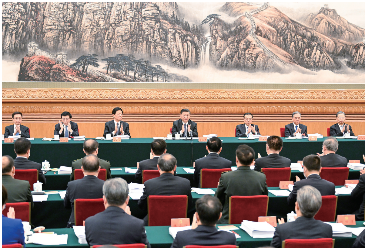
10月18日,中国共产党第二十次全国代表大会主席团在北京人民大会堂举行第二次会议。习近平、李克强、栗战书、汪洋、王沪宁、赵乐际、韩正等出席会议。

新华社北京10月18日电 中国共产党第二十次全国代表大会主席团18日下午在人民大会堂举行第二次会议。